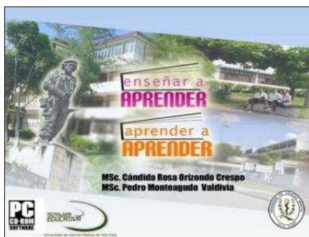
Fig. 1 Caratula del CD-ROM