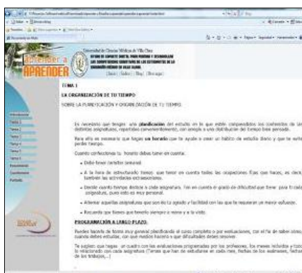
Fig. 3 Sesiones de trabajo