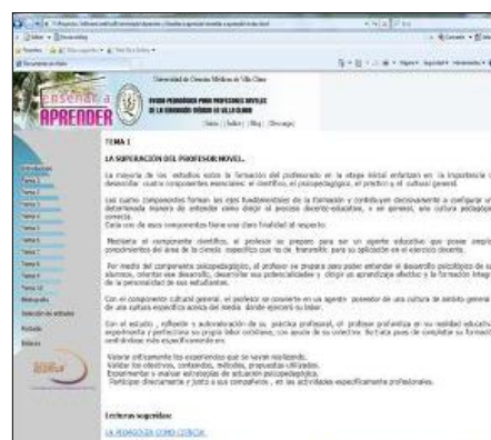
Fig. 4 Sesión de trabajo