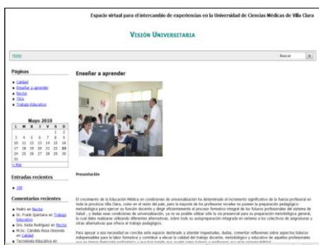
Fig. 5 Blog